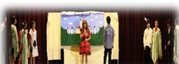
2組 Alice in real world (差別)