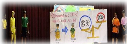
4組 暴走する価格 (物価上昇)