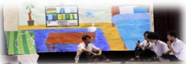
1組 紳士降臨 (いじめ)