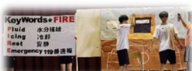
5組 Hot Limit (熱中症)