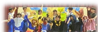
3組 ゴシップクエスト (SNS)