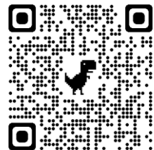
1年学年会へのご意見