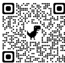
金津高校ホームページ

なお、 遅刻・欠席の連絡フォーム は別にご覧いただけます。なお、緊急の場合は学校代表TEL 0776-73-1255 をご利用ください。